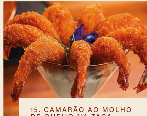
15. CAMARÃO AO MOLHO DE QUEIJO NA TAÇA