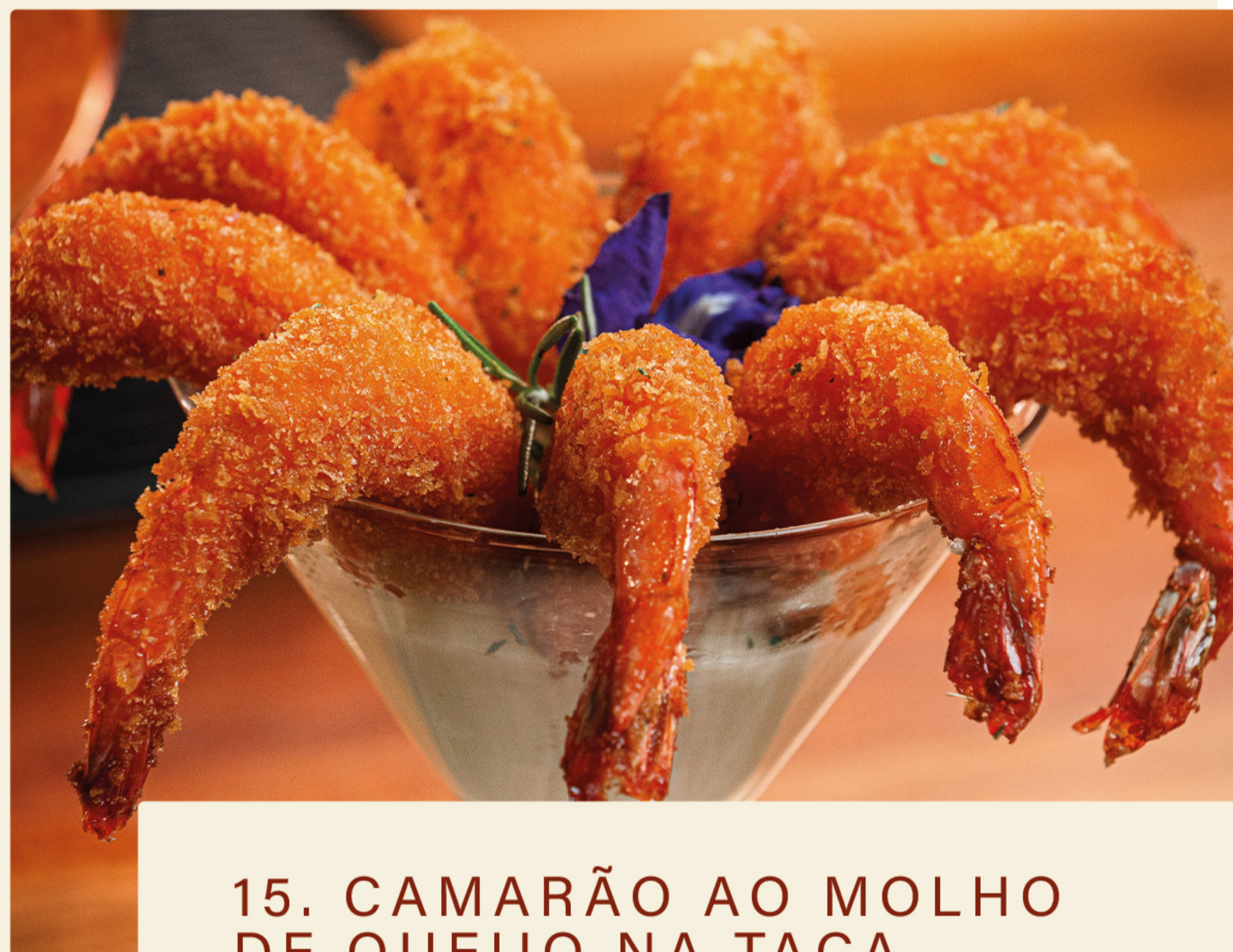
15. CAMARÃO AO MOLHO DE QUEIJO NA TAÇA